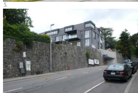
1. Halle d'exposition et de commerce, Aigle 2. Transformation d'un socle commercial, Lausanne 3. Conservatoire, restaurant et UAPE, Yverdon 4. Immeubles HBM, Foyer de Sécheron, Genève 5. Ateliers, administration, restaurant et crèche, Le Mont-sur-Lausanne 6. Immeuble de 7 appartements en PPE, Pully